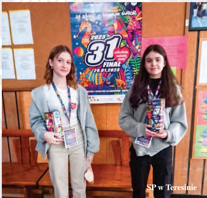
SP w Teresinie