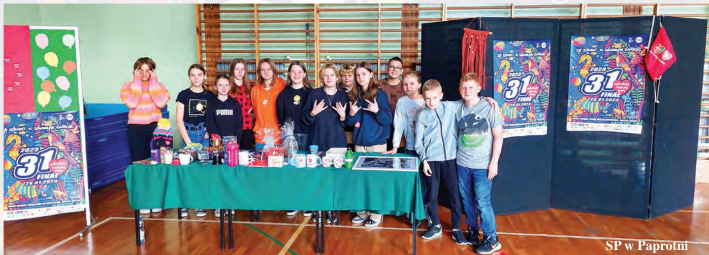
SP w Paprotni

Tradycja grania dla Wielkiej Orkiestry Świątecznej Pomocy w tej szkole sięga wielu lat wstecz. Uczniowie zbierali pieniądze dla Orkiestry niemalże od początku jej działania. Jednak najlepsze wyniki finansowe i dobrą zabawę osiągnęli przeważnie podczas szkolnych aukcji. Temu przedsięwzięciu zawsze towarzyszyło немало wysiłku, ale i wiele zabawy. Nie inaczej było 31 stycznia 2023 roku, dwa dni po Wielkim, również trzydziestym pierwszym, Finale. Uczniowie, z samodzielnie przyniesionych przedmiotów i rękodzieła, orkiestrowych gadżetów od sochaczewskiego