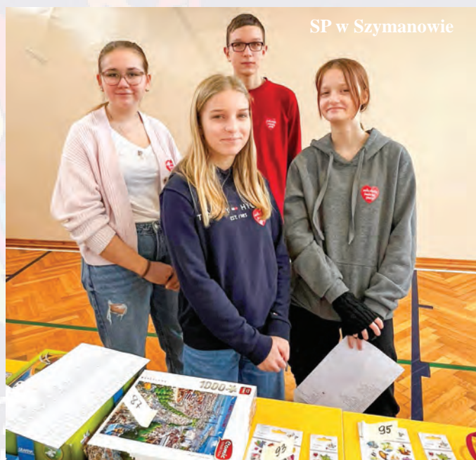
SP w Szymanowie