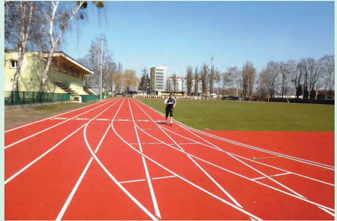
Stadion im. Stanisława Wójcika w Teresinie