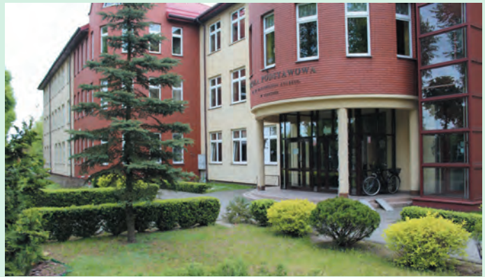
Szkoła Podstawowa im. św. Maksymiliana Kolbego w Teresinie