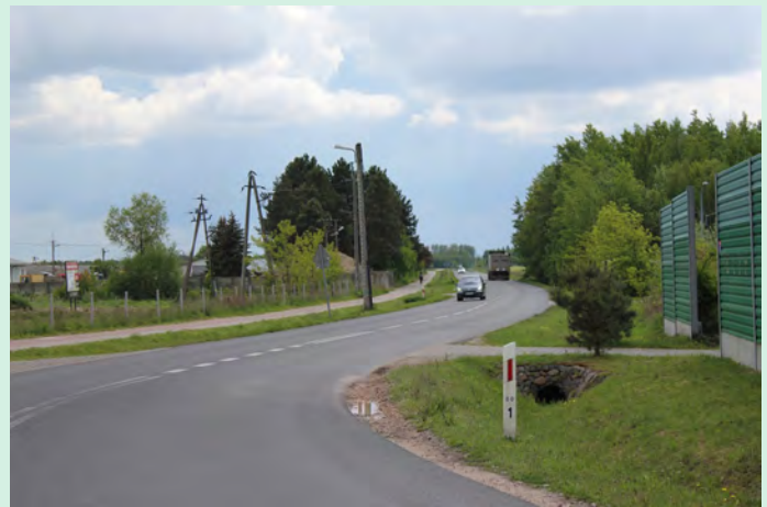
Obwodnica Teresina – Trakt św. Jana Pawła II