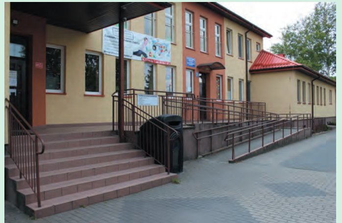
Gminny Zakład Gospodarki Komunalnej i Społeczne Przedszkole Integracyjne