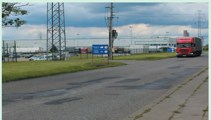
Park logistyczny Teresin