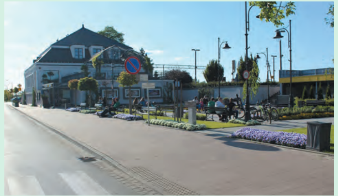
Dworzec PKP i Skwer Niepodległości