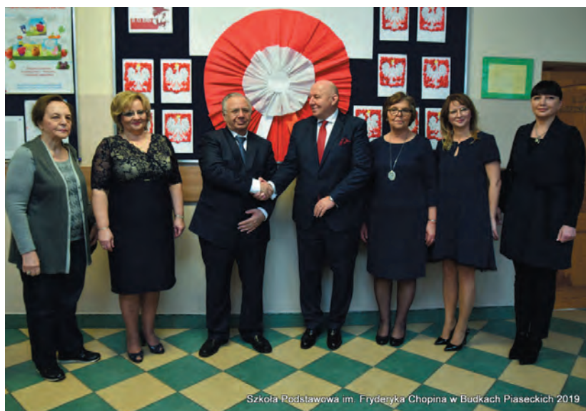
Szkoła Podstawowa im. Fryderyka Chopina w Budkach Piaseckich 2019

Przygotowany apel wprowadził zebranych w świą-