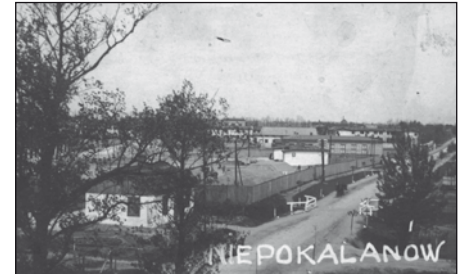
Ulica Kolbego, rok 1945