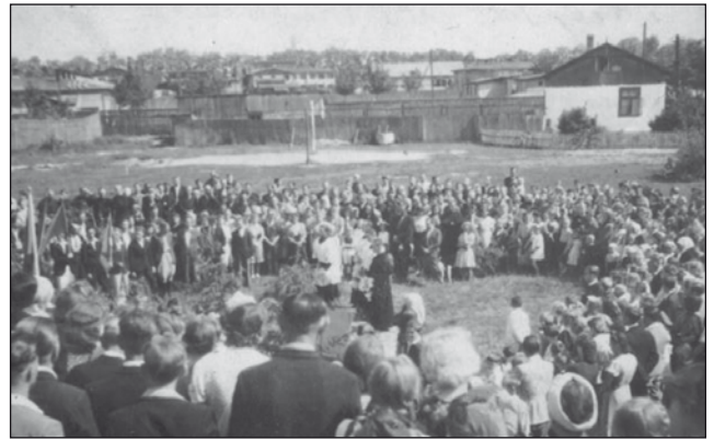
Uroczystość odsłonięcia Pomnika, maj 1945r