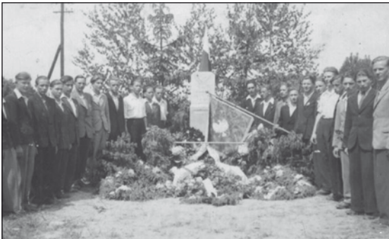
Młodzież przy Pomniku 20 Rozstrzelanych

Mój apel spotkał się z żywym odzewem Czytelników, za co serdecznie dziękuję. Otrzymałem kilka telefonów, spotkałem się ze świadkami i pasjonatami tych wydarzeń. Potwierdza się opinia