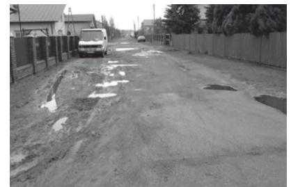
Ulica Leśna w Teresinie