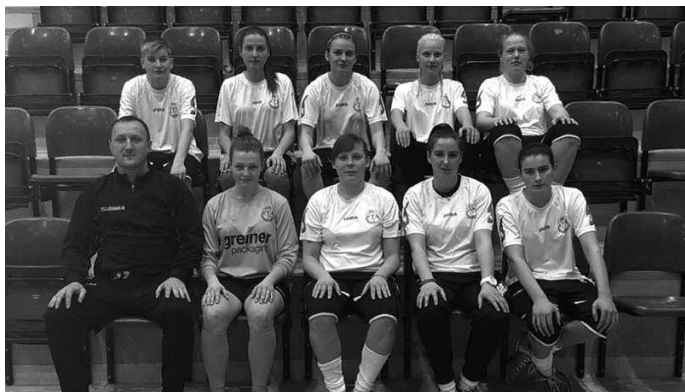
Brązowe medalistki KS Teresin w halowej piłce nożnej