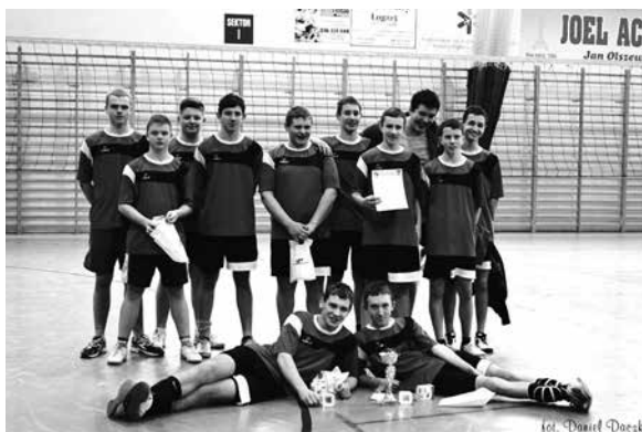
Zwycięska drużyna Gimnazjum w Teresinie

W piątek 31 stycznia br. w hali Gminnego Ośrodka Sportu i Rekreacji w Teresinie odbył się VIII. Turniej Piłki Siatkowej chłopców i dziewcząt gimnazjów o puchar dyrektora Gimnazjum im. św. Franciszka z Asyżu w Teresinie. Wzięły w nim udział szkoły z Kampinosu, Szymanowa i Wyczółek. Rywalizacja odbywała się na wysokim poziomie zarówno sportowym jak i organizacyjnym. Młodzi siatkarze i siatkarki bardzo żywiołowo reagowali na przebieg poszczególnych spotkań i w przerwach pomiędzy swoimi meczami