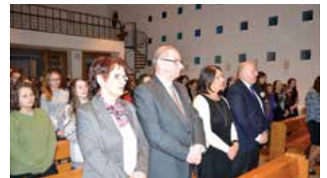
fol. Starostwo Powiatowe Sochaczew