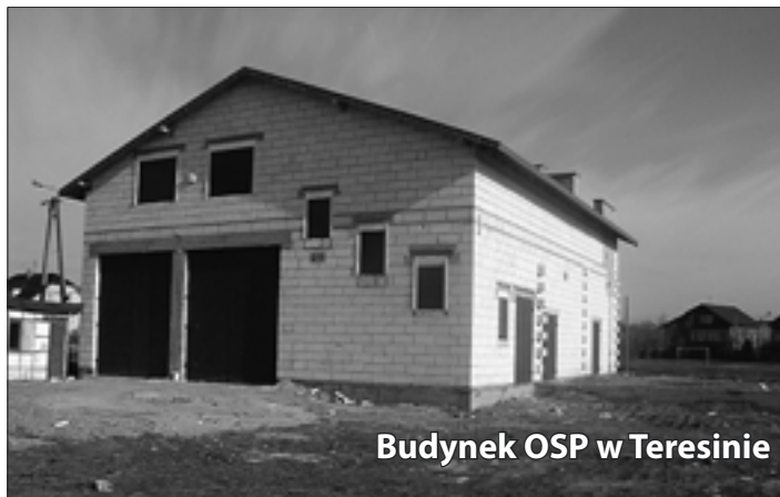
Budynek OSP w Teresinie