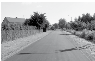
Nowa nakładka na drodze Maszna - Pawłowice

Okres realizacji zadania 30.09.2014 – 30.06.2015. W ramach projektu zbudowano 1,93 km sieci wodociągowej (Nowe Gnатовice, Nowa Piasecznica, Paprotnia) i 5,54 km sieci kanalizacyjnej (Granice, Paprotnia, Teresin-Gaj). Powstało 5 przepompowni. Z wybudowanej in-