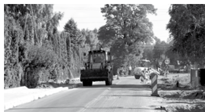
Modernizacja drogi kampinoskiej

Trwa generalna przebudowa drogi Kampinoskiej na odcinku Paprotnia – Krubice finansowana przez Gminę Teresin, Powiat Sochaczewski z wykorzystaniem środków Narodowego Programu Przebudowy Dróg Lokalnych. Przypomnijmy, że projekt przebudowy przewiduje m.in. poszerzenie jezdni do 9 metrów i wyodrębnienie ścieżki rowerowej, przebudowę skrzyżowania ul. Kampinoskiej z ul. Gnatowicką, Skośną i drogą na Masznię. Postulaty mieszkańców oraz spotkanie na drodze z inwestorem i wykonawcą doprowadziły