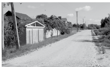
Ulica Modrzewiowa w Granicach - zakończona budowa kanalizacji

frastruktury korzystać będzie co najmniej sto kilkadziesiąt osób.