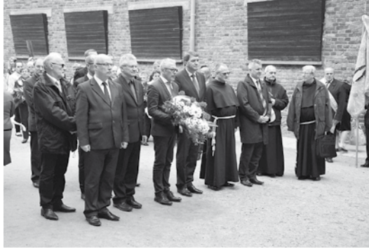
Przed Ścianą Śmierci w KL Auschwitz

Zjazd rozpoczął się złożeniem kwiatów i modlitwą przy Ścianie Śmierci oraz w Celi Śmierci Ojca Maksymiliana. W pierwszej części delegaci wzięli udział w XXXIV sesji kolbiańskiej „Rodzina źródłem miłości i odwagi ponad śmierć”, zorganizowanej przez Katolickie Stowarzyszenie „Civitas Christiana”, Centrum św. Maksymiliana w Harmężach, Starostwo Powiatowe w Oświęcimiu, Urząd Miasta Oświęcim oraz Państwową Wyższą Szkołę Zawodową im. rtm. W. Pileckiego w Oświęcimiu.