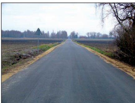
Droga Seroki – Gągolina