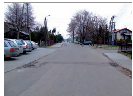
Ulica Zielona w Teresinie