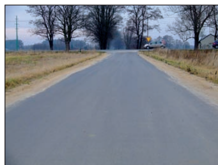
Droga w Topołowie