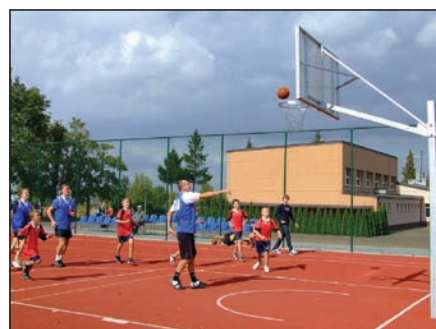
Boiska „Orlik” w Szymanowie