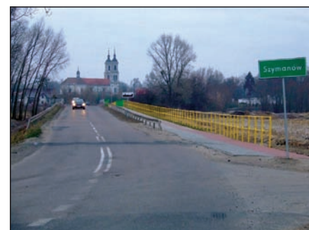
Ciąg pieszo-rowerowy dotarł do Szymanowa