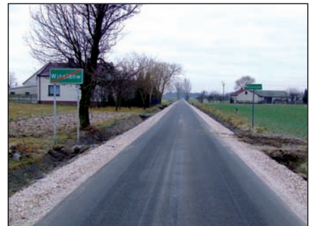
Droga Budki Piaseckie – Mikołajew