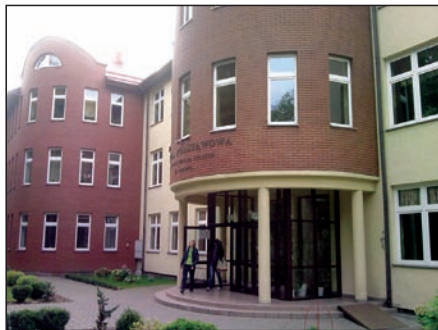
Szkołę Podstawową w Teresinie podłączono do sieci gazowej