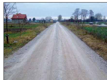
Połączenie ulicy Spacerowej z drogą przy Tesco