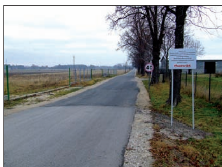
Droga do Pawłowic