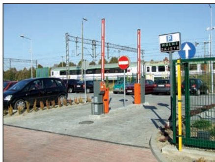
Parking „Parkuj i Jedź” w Teresinie