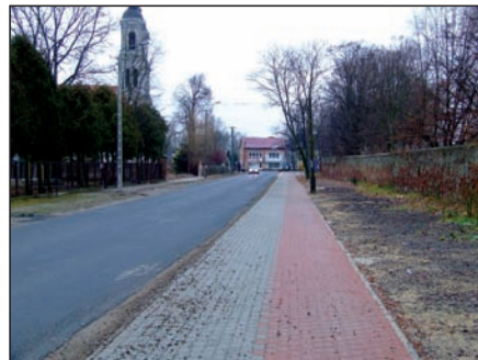
Ciąg pieszo-rowerowy w Szymanowie