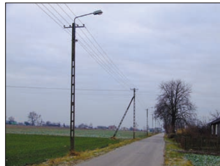
Oświetlenie drogi w Pawłótku