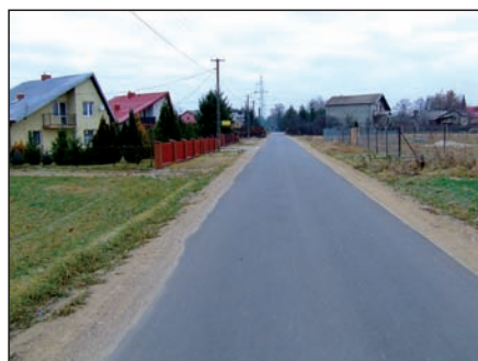
Ulica Skośna w Paprotni