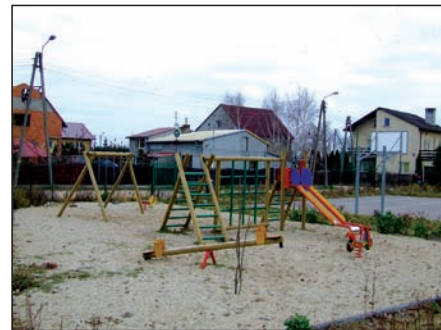
Plac zabaw w Serokach-Parceli