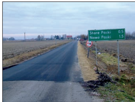
Droga do Nowych Pask