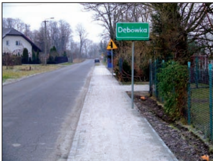
Chodnik w Dębówce