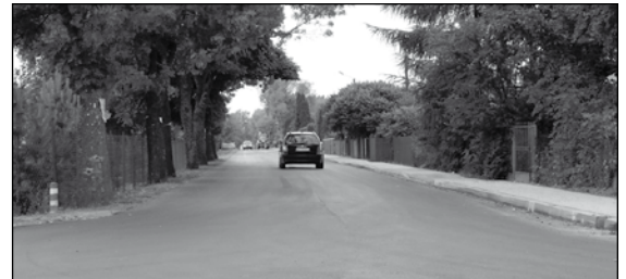
Droga w Elzbietowie