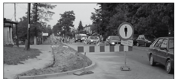
Ulica Kolbego w Paprotni