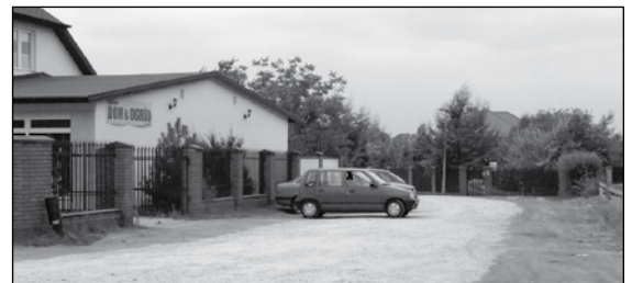
ul.Wesoła w Paprotni