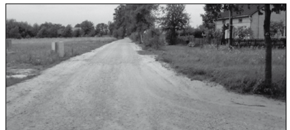
Droga w Pawłowicach