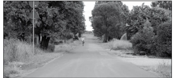
ul.Strazacka w Teresinie